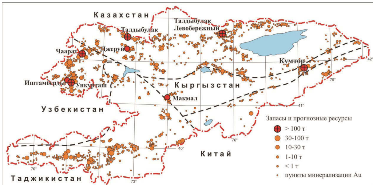
Рис. 1. Размещение золотого оруденения и крупных месторождений золота в Кыргызстане.

находится в прямой зависимости от степени окварцевания. Золото в основном содержится в халькопирите. В аргиллизитах развиты кварцевые жилы с самородным золотом.