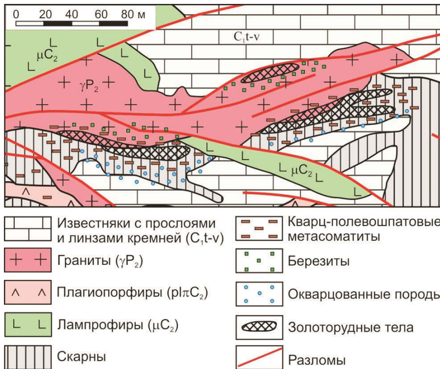
Рис. 3. Метасоматическая зональность на месторождении Макмал (фрагмент).

Запасы и ресурсы золота месторождения Ункурташ – 50 т, среднее содержание – 2–3 г/т. Оно относится к золотокварцевой формации и сформировано в условиях активной континентальной окраины. Золотое оруденение находится в гранодиоритах Андагульского массива ( C_2 ). Вмещающие породы сложены кристаллическими сланцами, гнейсами, амфиболитами семизсайской свиты ( PR_1? ) и алевролитами, туфопесчаниками, туфами дацитов арчаконушской свиты ( D_1 ). Гранодиориты секутся несколькими разломами северо-восточного простирания, вдоль которых развиты гидротермальные изменения (калишпатизация, окварцевание, каолинизация, березитизация, пропилитизация). На месторождении выделено несколько минерализованных зон. Главная, наиболее мощная и богатая, – минерализованная зона Основная протяженностью 1150 м, мощностью 100–200 м; ее длина по падению 600 м. Зона сложена кварц-полевошпатовыми жилами и прожилками мощностью 1–10 см, в которых находится основная часть золота; повышенные содержания обнаруживаются и вне жил. Рудные минералы представлены золотом, пиритом, молибденитом, антимонитом, арсенопиритом, шеелитом.